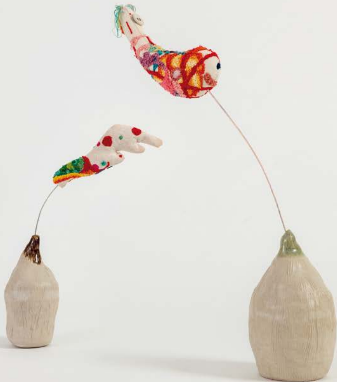
The fragment series: Flapper, 2023 ricamo su tela, filo metallico e ceramica | embroidery on canvas, wire, ceramic base 28.5 x 26 x 9 cm