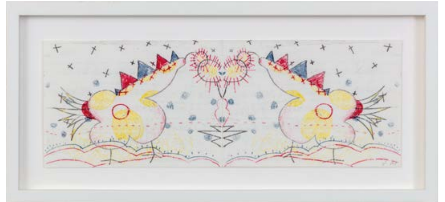
If it had happened otherwise, 2021 monostampa con inchiostri carbone su carta | carbon inks monoprint on paper Ed. 1 of 1 23 x 50 cm (con cornice | framed)