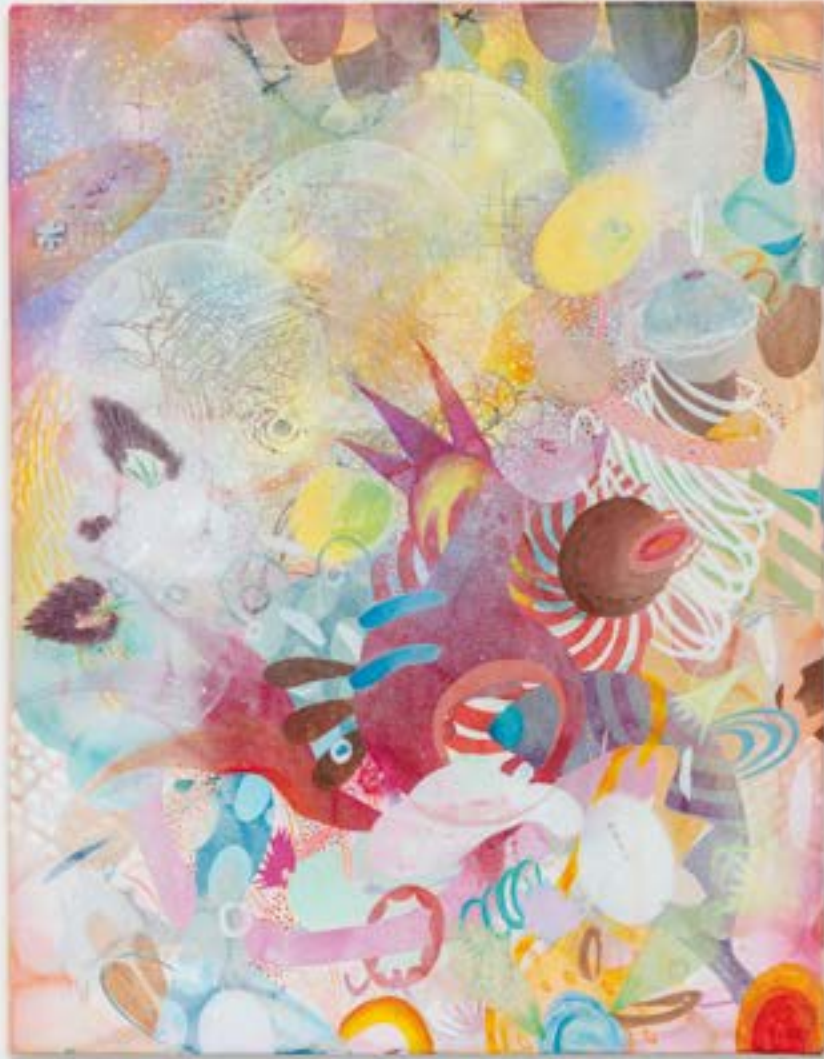
Disturbance , 2022 acrilico, vernice spray e ricamo su tela | acrylic, spray paint and embroidery on canvas 46 x 36 cm