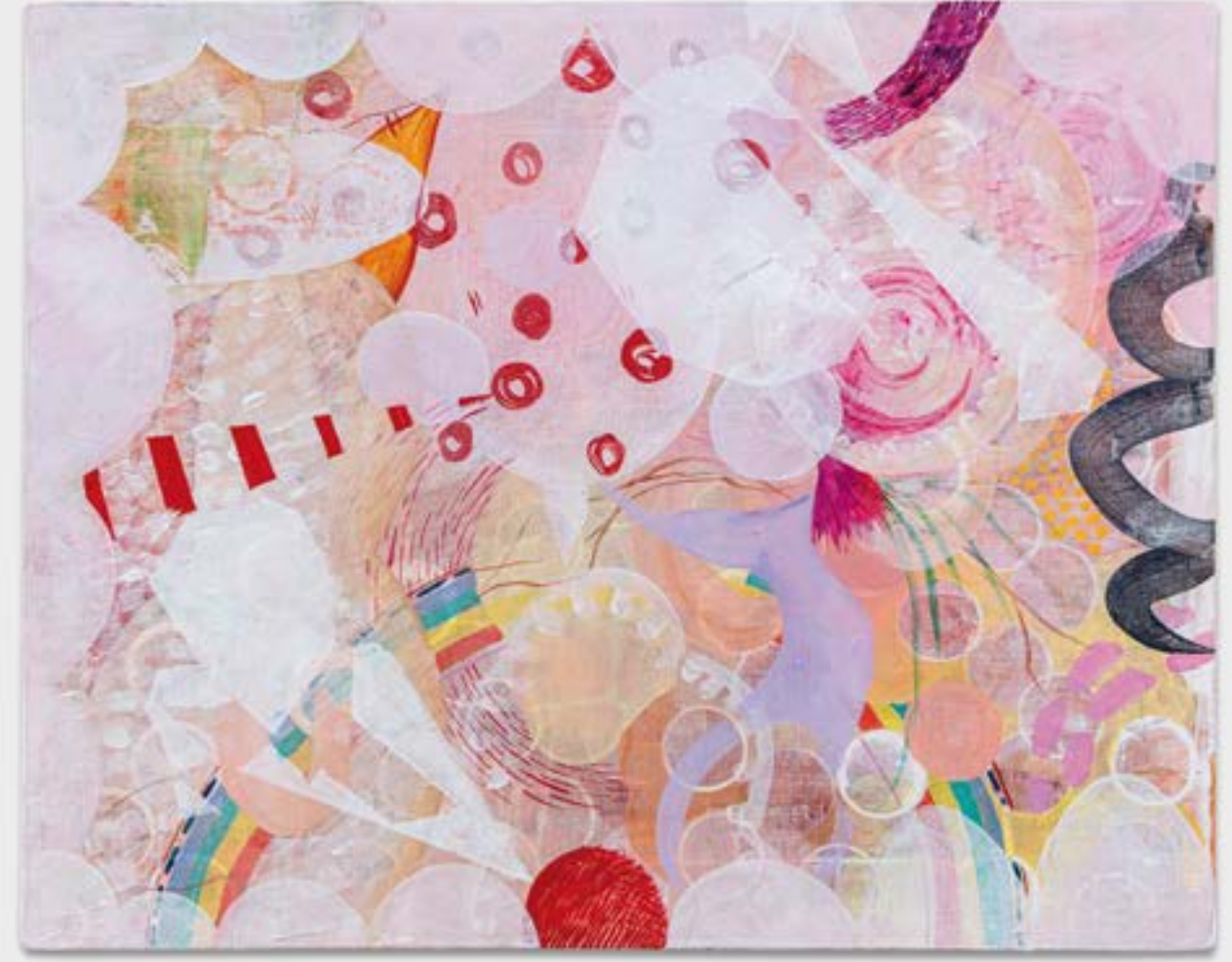
Stellar Energy I, 2021 acrilico su cartone telato | acrylic on canvas board 40 x 50 cm