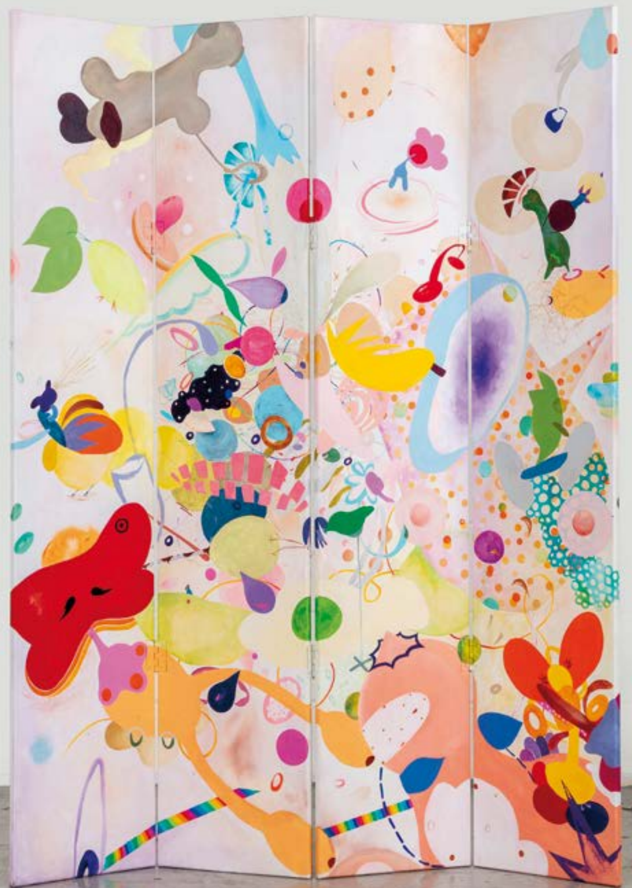
Upon the sightless couriers of the air, 2023 acrilico e stampa a getto d'inchiostro su tela | acrylic and inkjet on canvas 128 x 257 cm