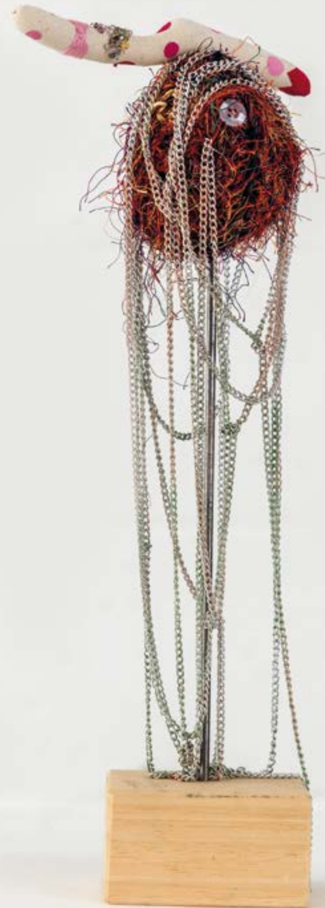
Mr. Puff , 2022 tecnica mista | mixed media 36 x 16 x 14 cm