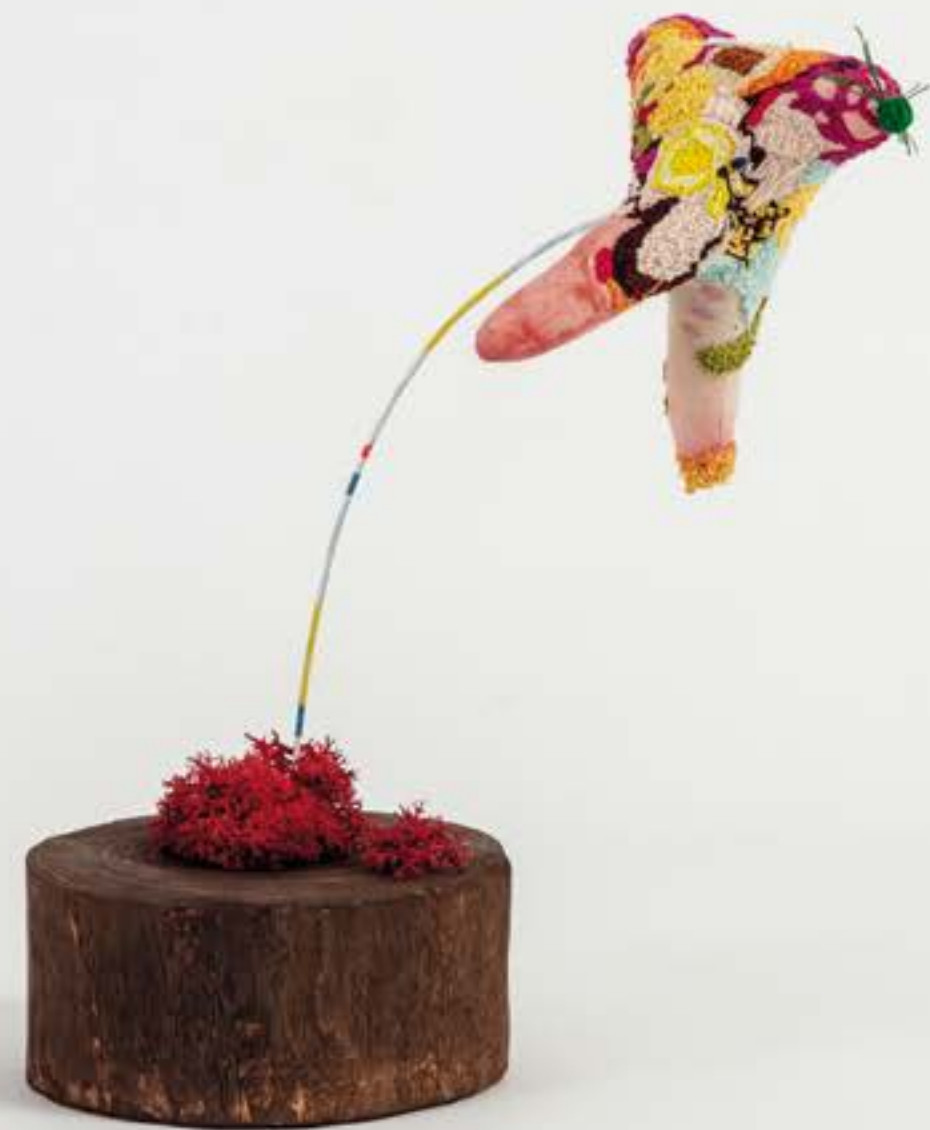
The fragment series: Famble, 2023 ricamo su tela, filo metallico, muschio artificiale e legno | embroidery on canvas, wire, artificial moss, wooden base 30 x 28 x 14 cm