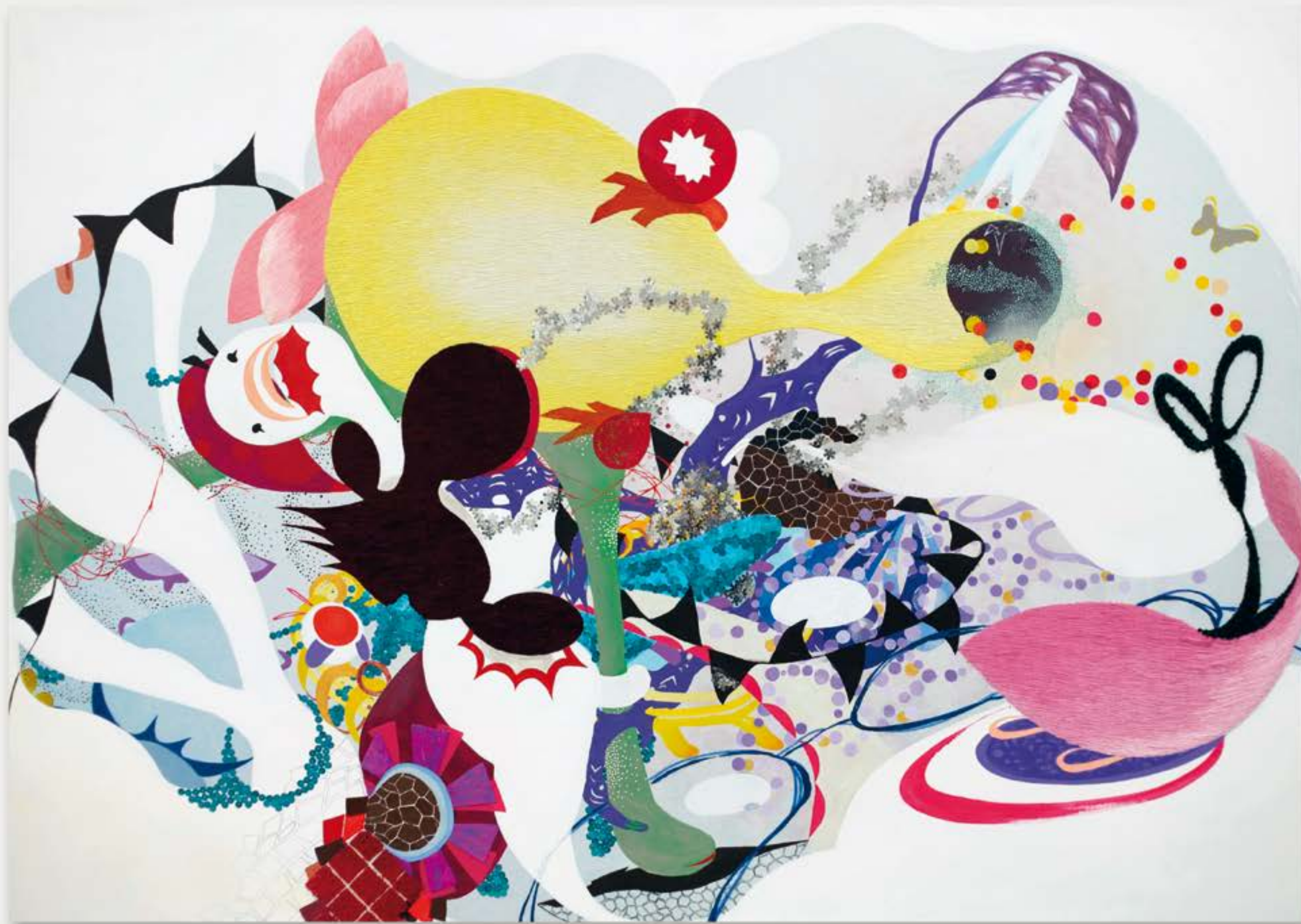
I run to you, 2012 acrilico e decorazioni su tela | acrylic and emellishment on canvas 102 x 142 cm Collezione privata | Private collection