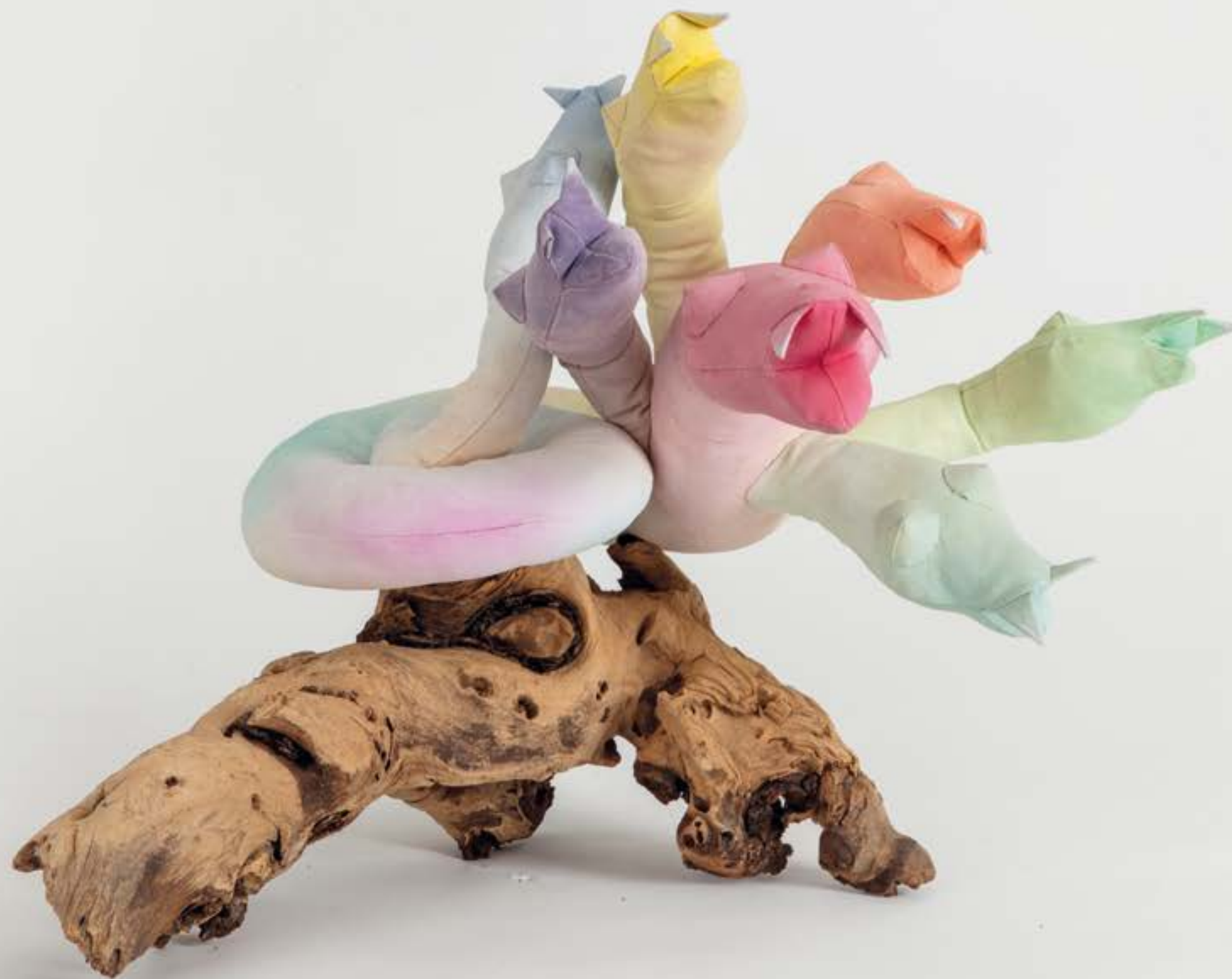
Naga , 2018 acrilico su tela, imbottitura e legno | acrylic on canvas, filling, driftwood 60 x 43 x 43 cm