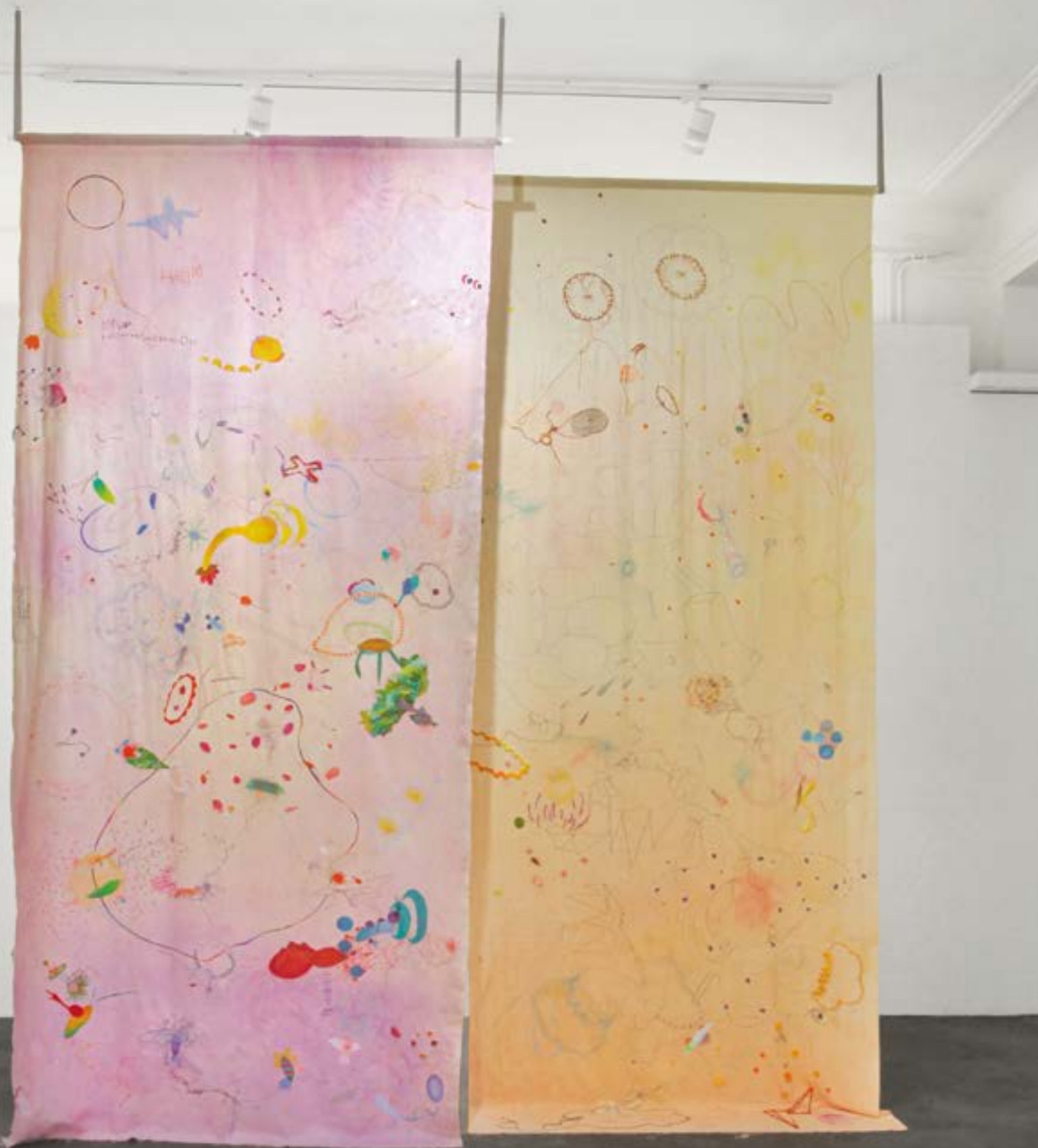
Osmosis symphony #1 , 2016-2023 ricamo, matita colorata e acrilico su tela | embroidery, colour pencil & acrylic on canvas 372 x 165 cm