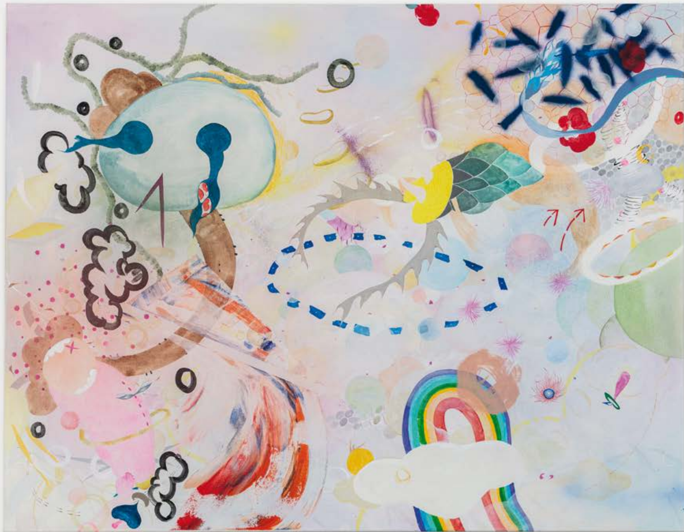
Law Of Attraction , 2018 acrilico su tela | acrylic on canvas 140 x 180 cm