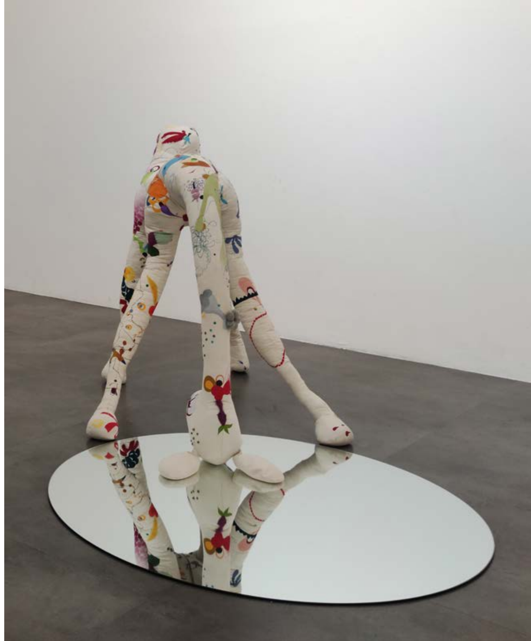
ULLU , 2008 tecnica mista | mixed media 160 x 106 x 110 cm