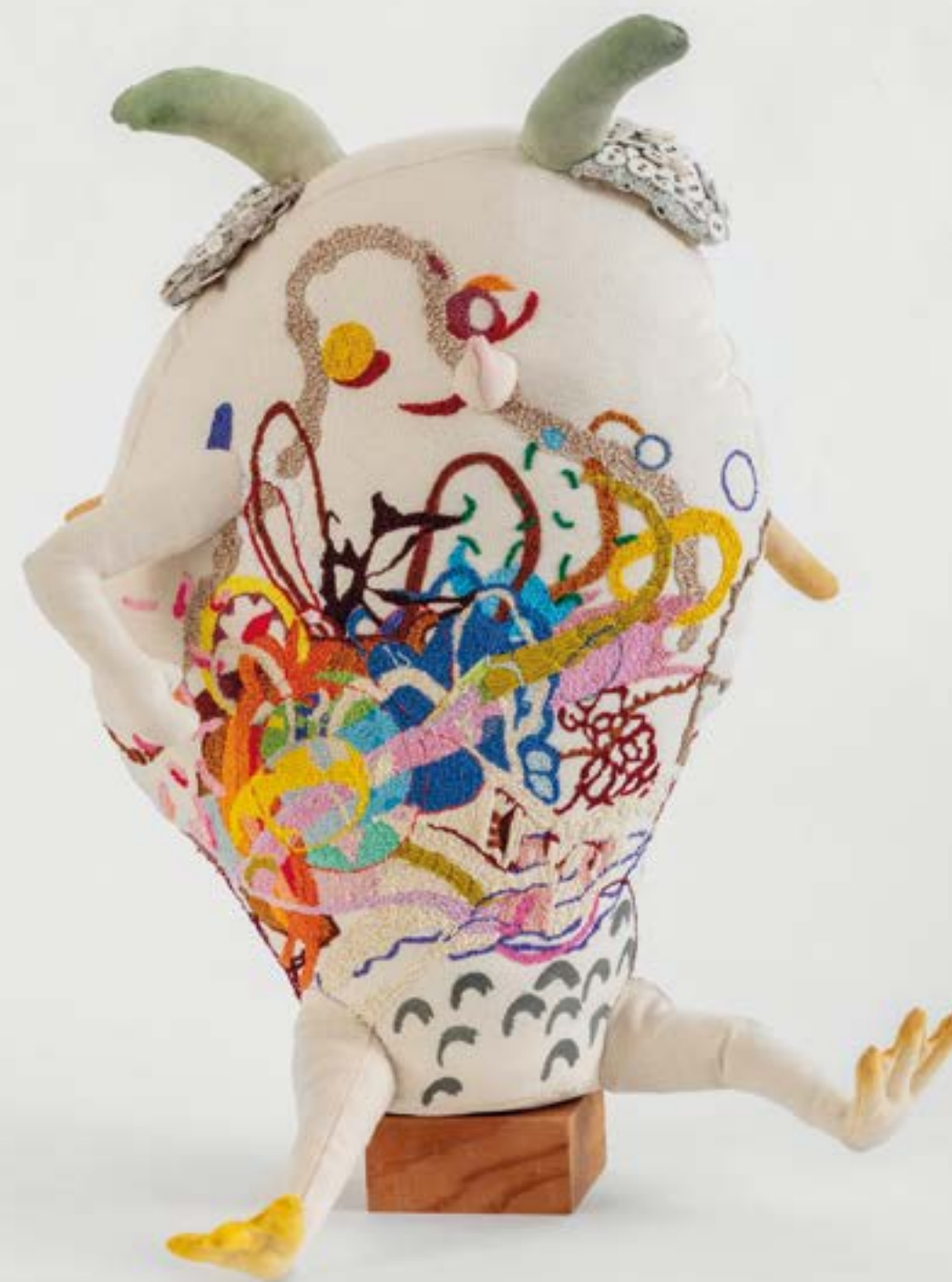
Boy A, 2023 acrilico su tela, ricami e imbottitura | acrylic on canvas, thread and fillings 55 x 50 x 40 cm