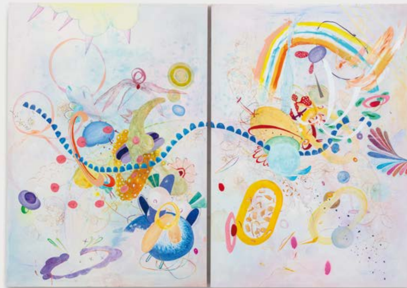
Rainbow Falls, 2023 acrilico su tela | acrylic on canvas 45 x 31,5 cm ognuno | each Collezione privata | Private collection