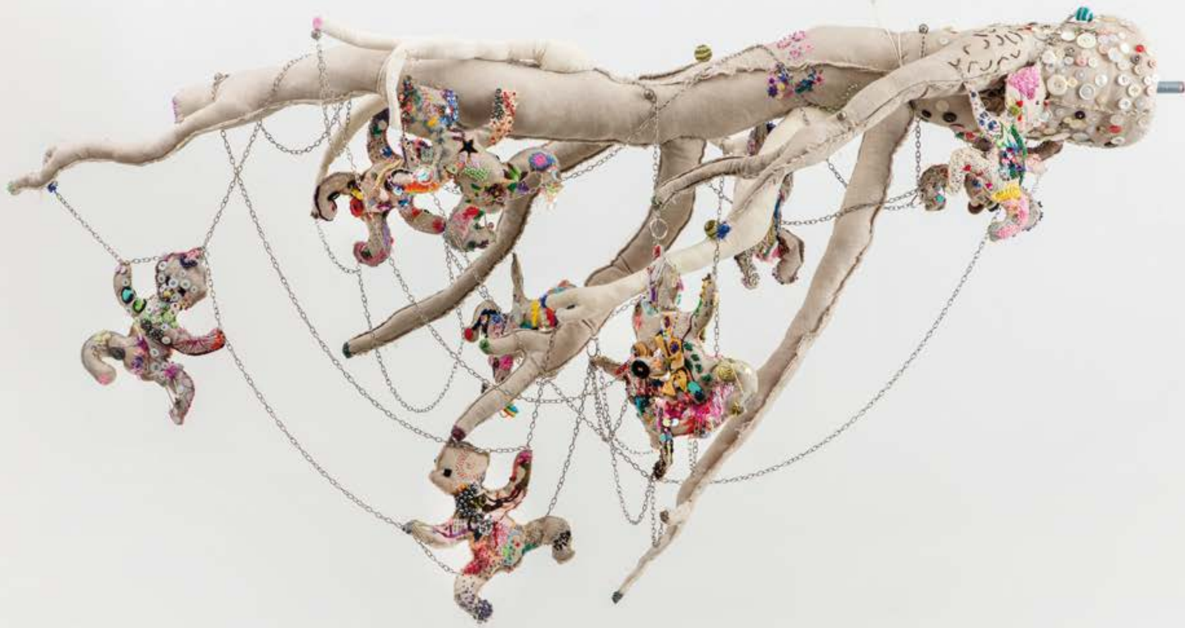
Family Tree , 2017 tecnica mista | mixed media 147 x 90 x 82 cm