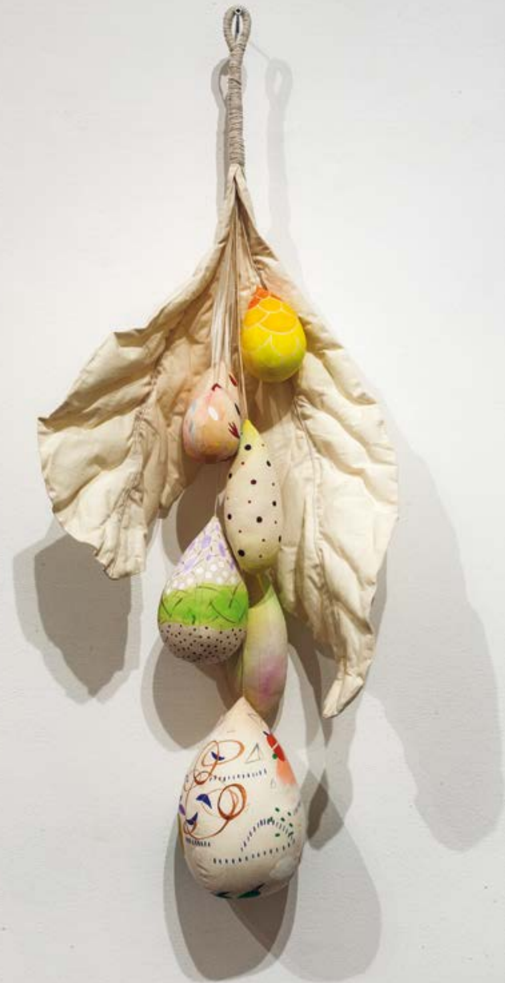
Plan B , 2014 inchiostro e collage su carta | ink and collage on paper 110 x 202 cm