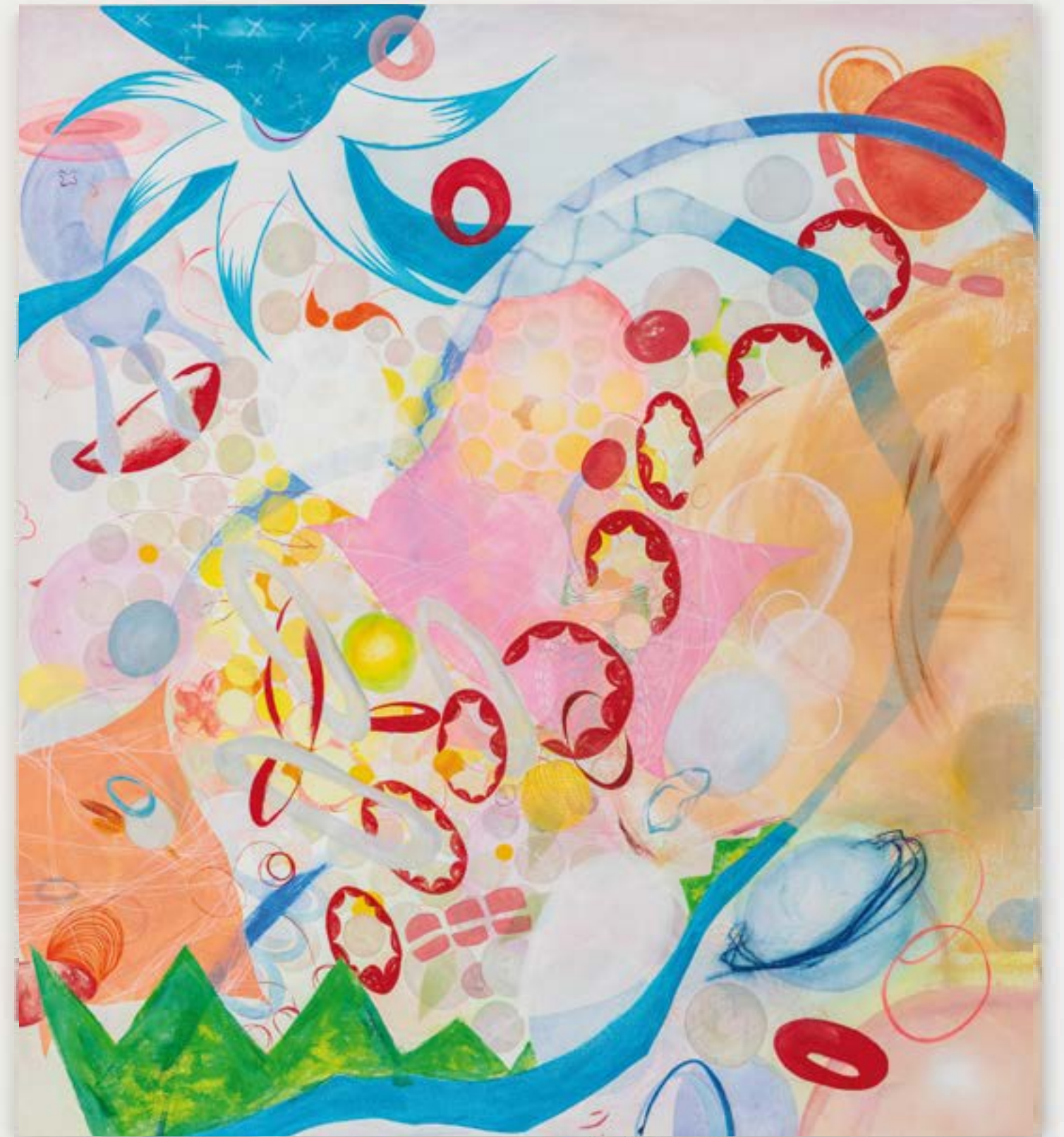
Pillow Fight , 2022 acrilico su tela | acrylic on canvas 100 x 90 cm