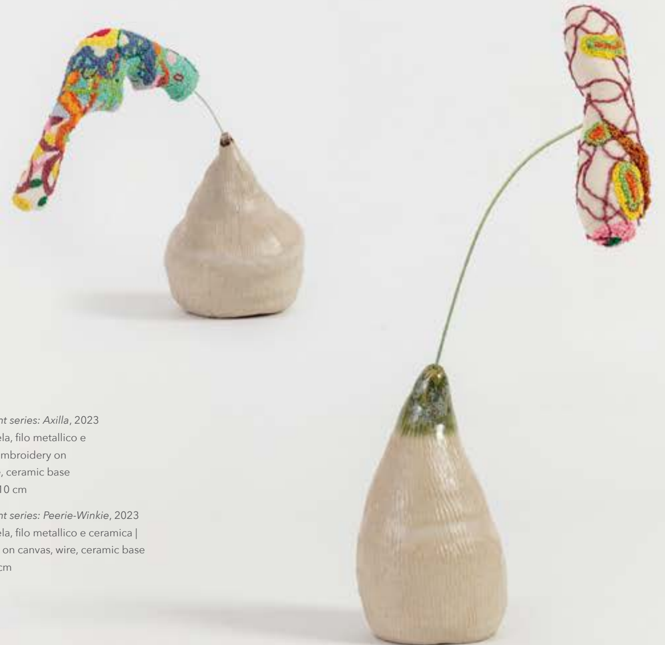
The fragment series: Peerie-Winkie, 2023 ricamo su tela, filo metallico e ceramica | embroidery on canvas, wire, ceramic base 30 x 18 x 8 cm