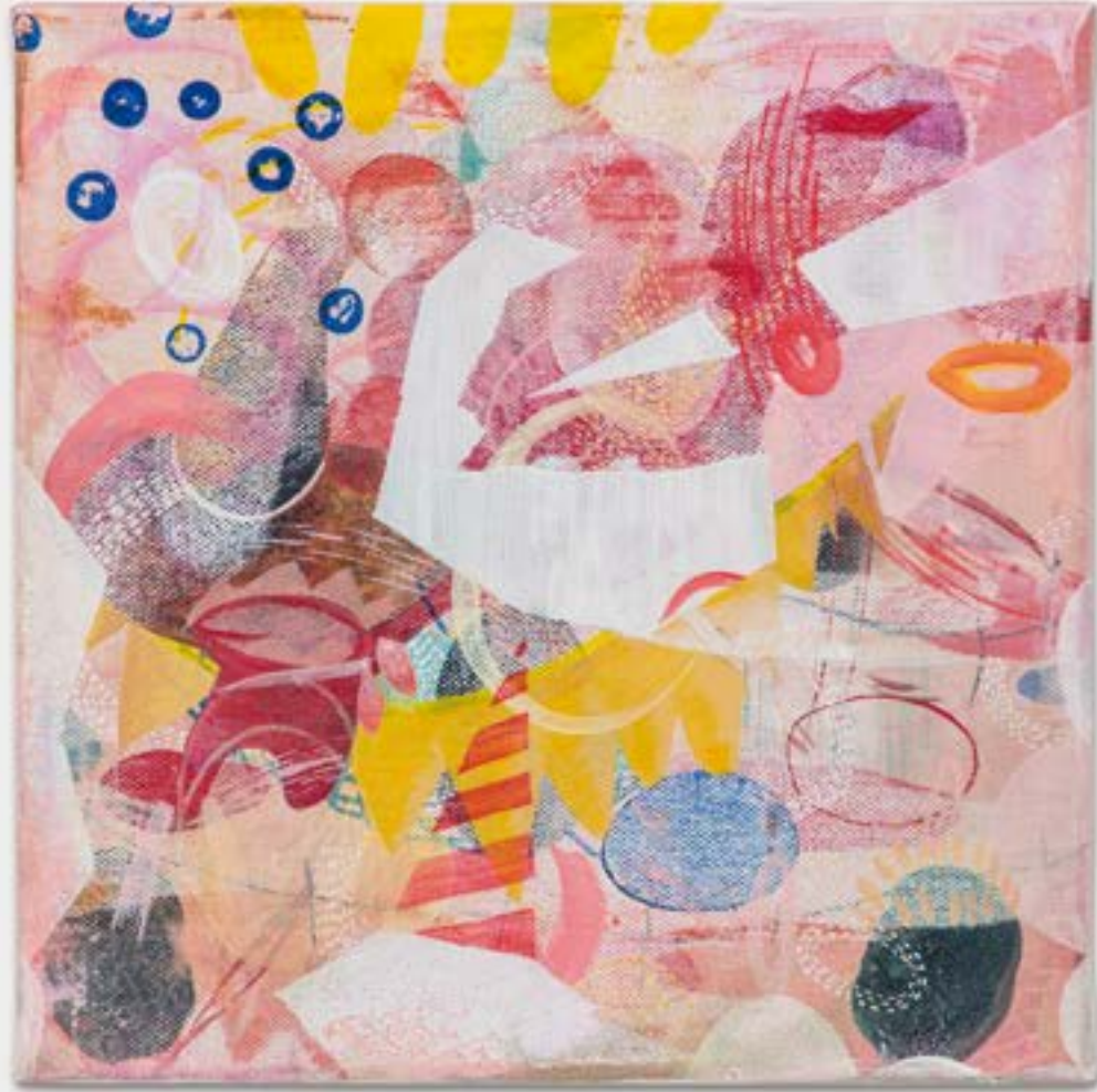
Pink Light, 2022 acrilico su tela | acrylic on canvas 25 x 25 cm